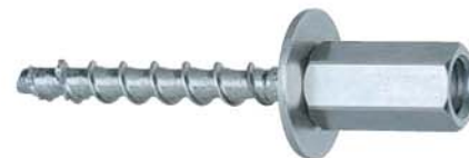
Шуруп по бетону FBS-M8/M10 , внутренняя резьба М8/М10